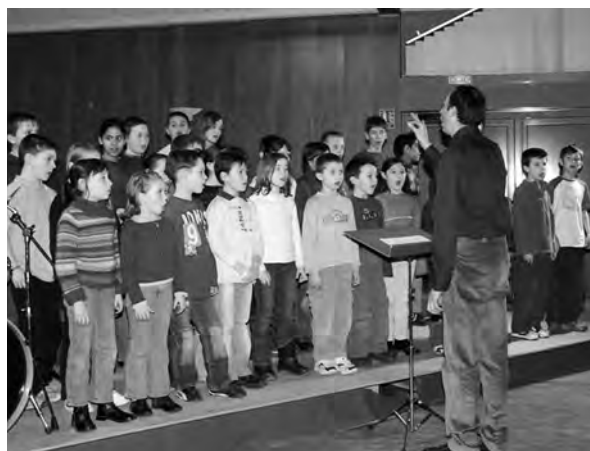
Le soir de l'audition

A noter au calendrier : Février 2007 (lieu à définir) avec l'audition des élèves. Celle de 2006 s'est déroulée à Bény et les murs de la salle Garavand résonnent encore de la prestation de tous, petits et grands.