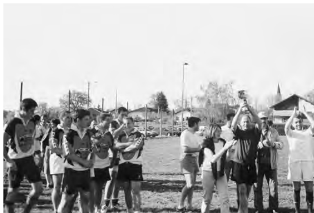
Tournoi de beach rugby - Avril 2006