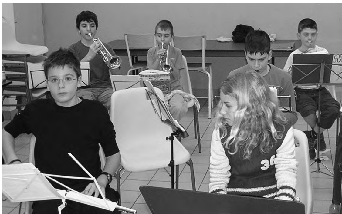
Les juniors au travail

Souhaitons que l'année à venir soit aussi passionnante.