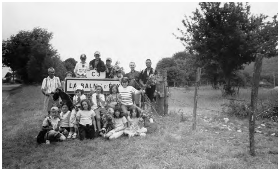
Journée d'amitié avec les enfants du caté et les servantes de messe

Pour toutes démarches et autres besoins, vous pouvez contacter les responsables de la paroisse ou le Père Luc Ledroit, à la cure de Marboz ☎ 04 74 51 00 45.