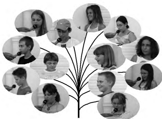
La traditionnelle remise des dictionnaires. Ou le bouquet d'adieu des CM2.

L'enfant sourit : Ça va être drôlement bien le théâtre !