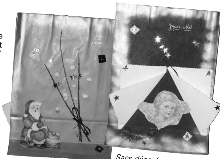
Sacs décorés par les enfants de la garderie

Les personnes de plus de 75 ans absentes ce jour là, recevront leurs colis dans les sacs décorés pour l'occasion par les enfants de la garderie.