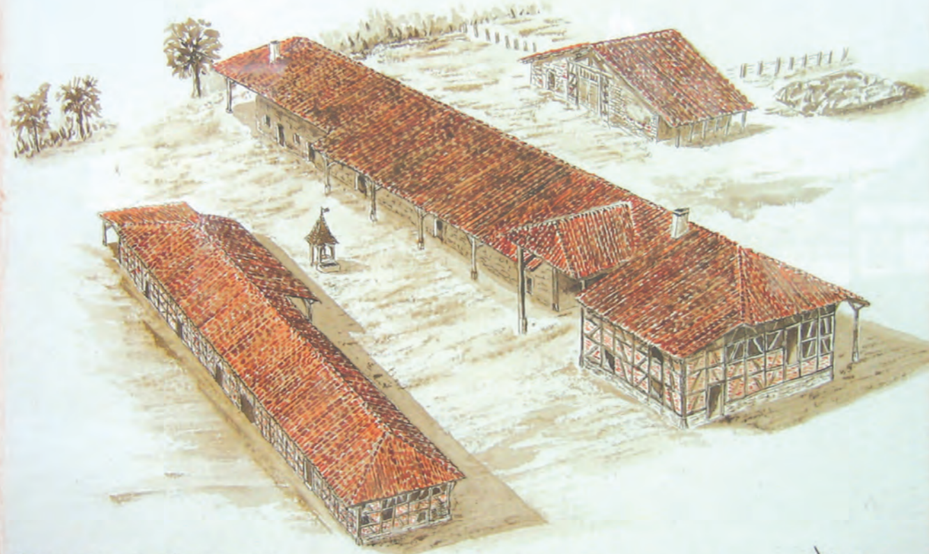
Domaine de Garavand

Zone A Zone B Zone C Vacances sous réserve