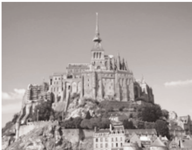
Mont St Michel