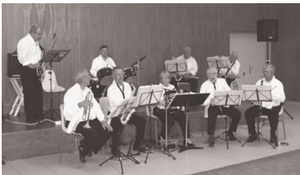
Groupe de musiciens " Les Ventres Jaunes "