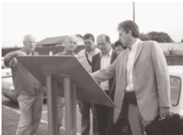
La réflexion s'organise sur la recherche d'un nouvel emplacement de l'école

La rentrée de septembre 2008 s'est effectuée avec l'accueil de 80 élèves pour 3 classes. C'est lourd pour les enseignants et leurs assistantes qui continuent à mener leurs projets pédagogiques. C'est pénalisant pour les enfants qui doivent davantage se discipliner et moins solliciter l'enseignant, a fortiori dans une classe à plusieurs cours.