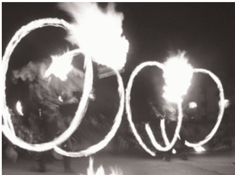
Fête du poulet

30 ème anniversaire de la fête du poulet de Bresse : " Quand le ciel s'assombrit sous la pluie, nous savons si nous avons des amis ". Ils arrivèrent de toutes les contrées pour nous prouver fidélité et solidarité. Merci à tous ainsi qu'aux bénévoles, sans eux rien ne serait possible, la municipalité pour le soutien et une subvention accordée, tous les partenaires, associations et sponsors. La vue d'ensemble est un succès. Rendez-vous pour la 31 ème fête du poulet de Bresse le dimanche 5 juillet 2009 à Bénvy.