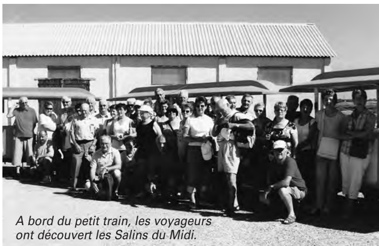
A bord du petit train, les voyageurs ont découvert les Salins du Midi.

Pour la 3 ème année consécutive, après l'Autriche et le Pays Basque, le comité organisait en 2009 un voyage en Provence et Camargue d'une semaine. Un voyage en Normandie est en projet pour 2010.