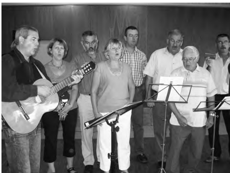
La troupe du Bien Allé de Lingeat