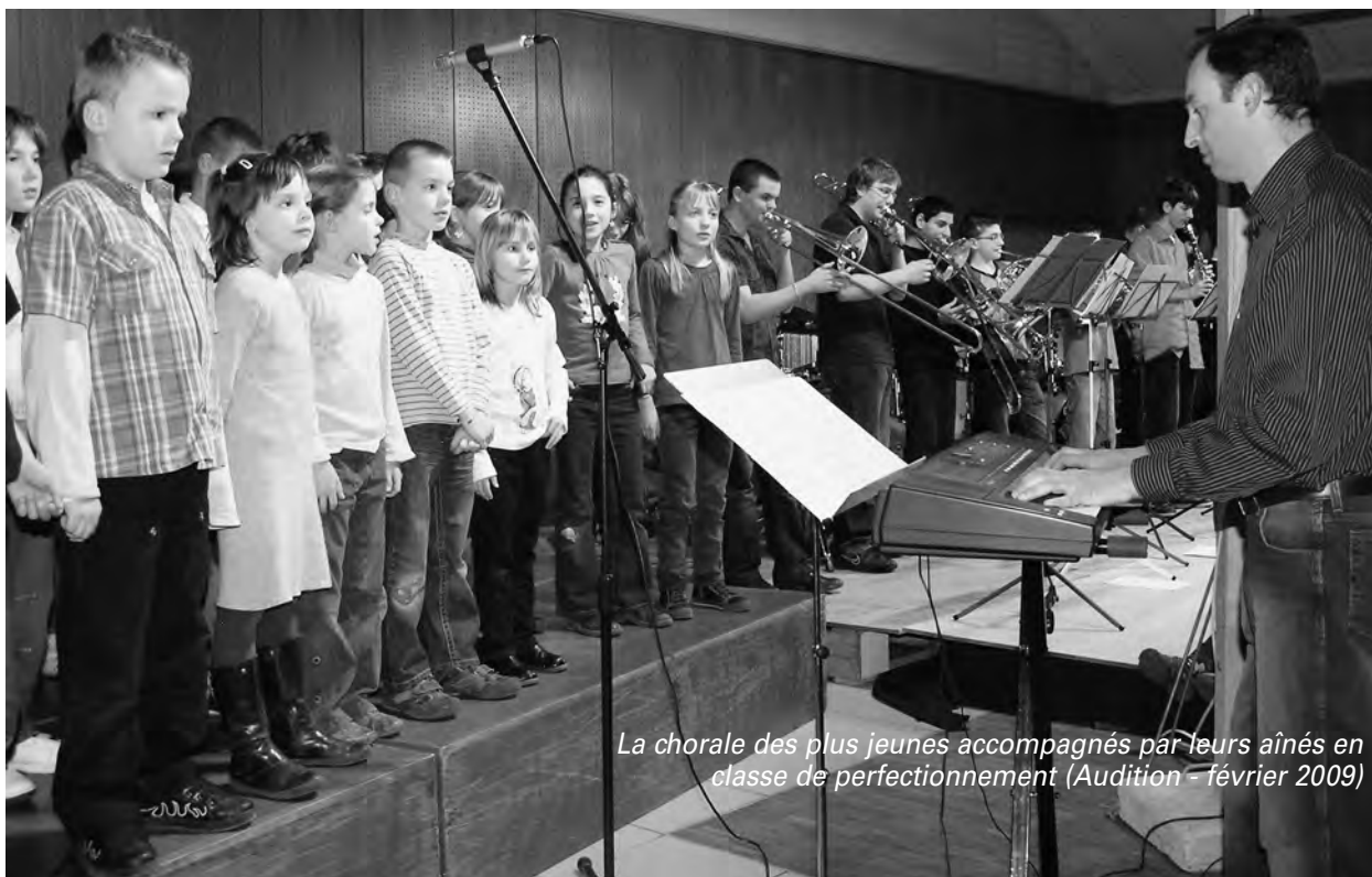
La chorale des plus jeunes accompagnés par leurs aînés en classe de perfectionnement (Audition - février 2009)