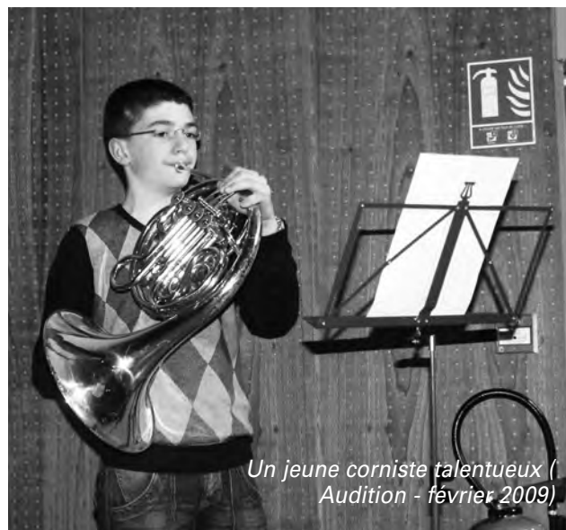
Un jeune corniste talentueux (Audition - février 2009)

Après quelques années d'apprentissage, des cours de formation orchestrale sont alors donnés aux jeunes musiciens afin de leur permettre d'intégrer, après avis de leur professeur et du directeur, l'une des deux harmonies cantonales.