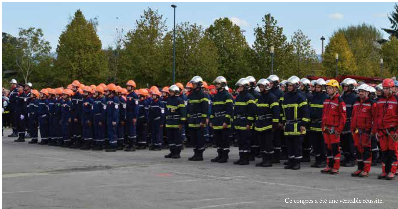
Ce congrès a été une véritable réussite.

Effectifs en hausse à la Compagnie des sapeurs-pompiers de Bény