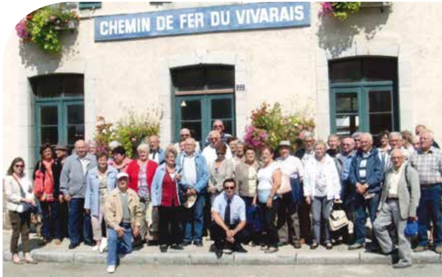
Voyage en Ardèche le 1 er août 2015