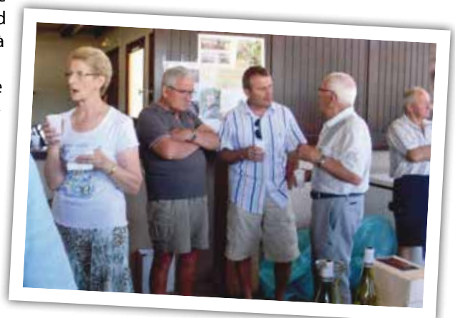
Monsieur le Maire avec le président de la FNACA lors de l'apéro du 14 juillet 2015

► Les 14, 15 et 16 octobre 2016 aura lieu le congrès national qui se déroulera à Bourg-en-Bresse. Il constituera un événement très important pour la FNACA. Ces trois journées mobiliseront de nombreux bénévoles. Tous les comités de l'Ain seront concernés.