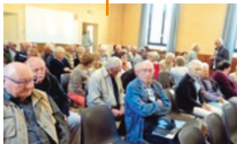
CÉRÉMONIE DU 8 MAI 1945