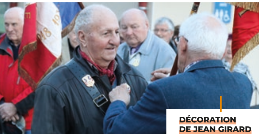
DÉCORATION DE JEAN GIRARD