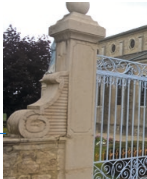
GRILLES DU CIMETIÈRE