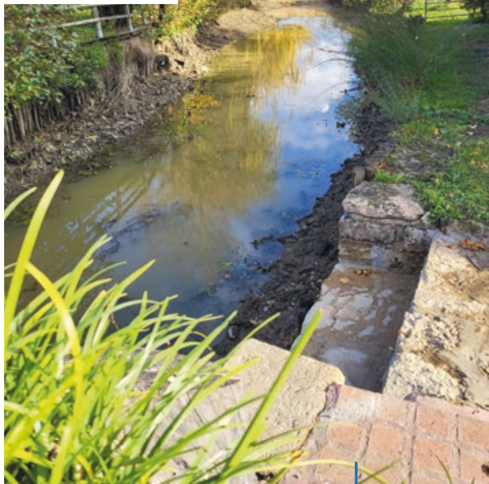
BATARDEAU AU PONT DU MOULIN DE MARMONT

Outre ces travaux nous avons adhéré en 2021 au programme national des ponts permettant un contrôle des ouvrages par une entreprise spécialisée. Le pré-diagnostic a eu lieu au printemps. Le compte-rendu fait apparaître un besoin de vérifications plus approfondies en début d'année sur le pont de la morte du moulin Blanc. Bien que sans danger imminent des travaux sont à prévoir.