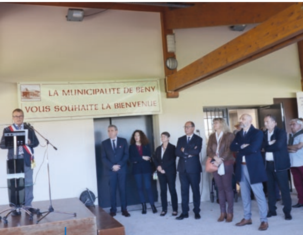
LES OFFICIELS À L'INAUGURATION