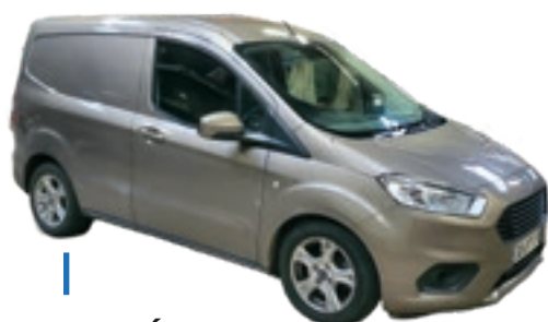
NOUVEAU VÉHICULE COMMUNAL