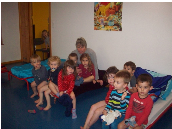
Moment de relaxation avant la sieste